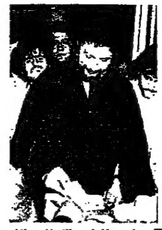
رئيس المجلس الاسلامي للشيعي الاعلى الامام موسى الصدر يرضع وزنته في صندوق الاقتراع